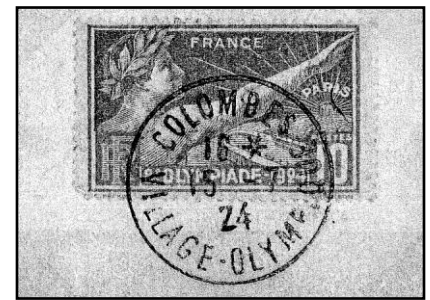
Parijs 1924, 8 e O. S., links Milon de Crotona, midden een zegevierende atleet met lauwerkrans en olijftak, rechts zegel met zegevierend atleet en eerste stempel van het Olympisch dorp