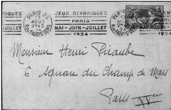
Parijs 1924, 8 e O.S., met doorlopend machinestempel

Om twee redenen ben ik uitdrukkelijk begonnen met deze greep uit de geschiedenis van zowel de collectie als van de thematische filatelie zelf. In de eerste plaats heb ik enkele behaalde bekroningen vermeld, om aan te geven dat we spreken over een verzameling van hoog niveau. In de tweede plaats moge het duidelijk zijn, dat we verzamelingen die onder heel andere beoorde-