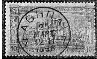
Athene 1896, 1 e O.S., op zegel Akropolis met lokaalstempel van Athene 7 op 25 maart 1896 (eerstedagstempel) Uiterst zeldzaam!

Ik noem dit uitdrukkelijk bouwstenen, het bovenstaande rijtje is uiteraard geen plan, omdat het niet compleet is en er in het geheel geen structuur in zit. Mijn bedoeling is alleen om aan te geven, hoe je een thema dat vrijwel altijd op dezelfde manier wordt aangepakt, ook eens geheel anders kunt gaan uitwerken.