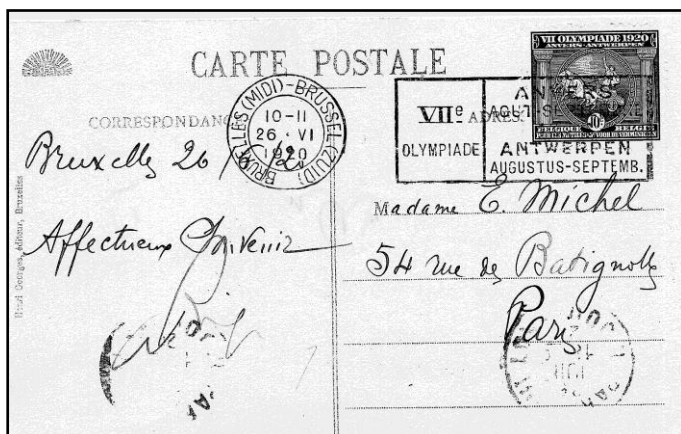
Antwerpen 1920, 7 e O.S., kaart met zegel en stempel