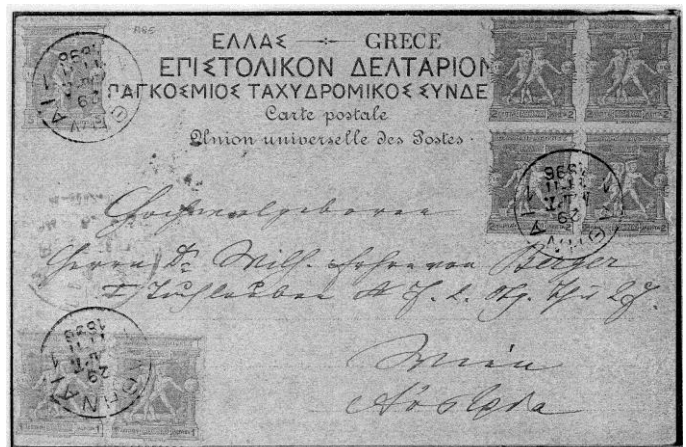
Athene 1896, 1 e moderne O.S., kaart met zegels OS en stempel van de 5 e dag, de dag met als hoogtepunt de marathon

De naam 'documentaire verzameling' werd gebruikt, omdat het de bedoeling was om je verhaal te documenteren met zoveel mogelijk variaties van bepaalde stukken die er van bestonden.