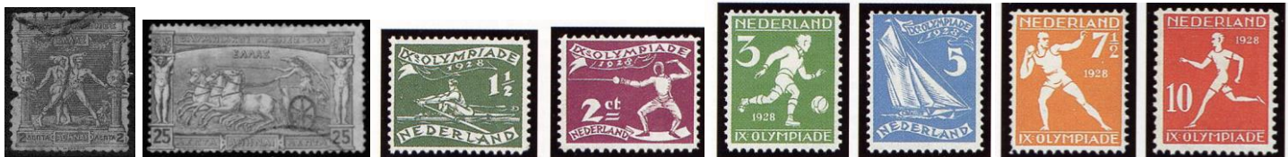
Athene 1896, 1 e Olympische Spelen. Zegels met Links vuistvechters en rechts vierspan (quadriga)