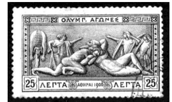
Athene 1906, Olympische tussen Spelen, gevecht van Heracles en Antaios

U ziet dit klinkt al heel anders, al is de gebruikte benaming voor de spelen van 1928 in Amsterdam meer goed bedoeld dan functioneel. Dit laatste blijft namelijk altijd een eis.