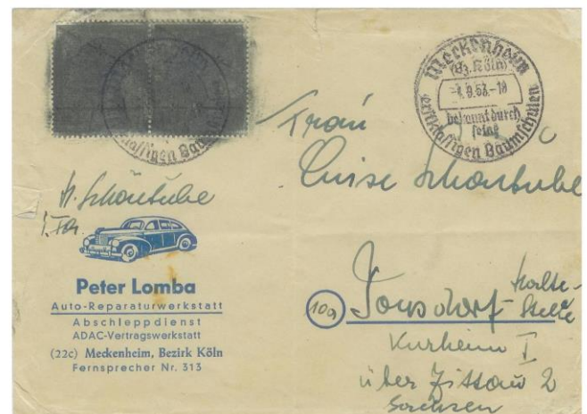
Afb. 1 Hier werden de postzegels onherkenbaar gemaakt

Voor de Koude Oorlog leverde veel postoorlog-post op. West-Duitse brieven met onwelgevallige postzegels werden terug gezonden naar de afzender. Zo vonden de Oost-Duitsers de West-Duitse postzegel die 'onze krijgsgevangenen' herdacht, beledigend voor hun Russische vrienden, want die hielden in 1953 nog veel Duitsers gevangen. De "verkeerde" zegels werden voorzien van grotere rode of zwarte inktklodders (afb. 1 en 2).