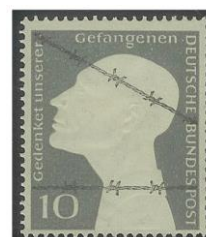
Afb.2 Dit is de zegel op de enveloppe van Afb. 1