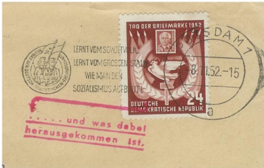
Afb.3 Men bestookte elkaar met stempels!

In Oost-Duitsland gebruikte men enige tijd de stempelvlagtekst: "Jugend! Vereinige dich im Kampf für den Frieden gegen die Gefahr eines neuen Krieges". De West-Duitse PTT drukte met een venijnig rood stempeltje de volgende tekst eronder af: "... aber nicht unter kommunistischer Diktatur!" Een ander voorbeeld (afb.3) was het Oost-Duitse vlagstempel met de tekst (vertaald): "Leert van het Sovjetvolk / Leert van de grote Stalin hoe men het socialisme opbouwt". In West-Duitsland voegde men daar met een rood stempel aan toe "...en wat daarvan terechtgekomen is." Zo was de stand weer 1-1.