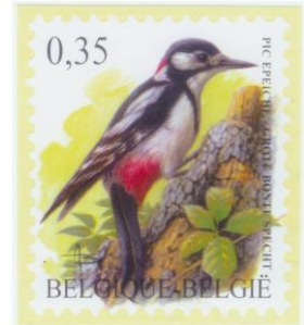
Afb. 1 De politieke grote bonte specht uit België

Dit Belgische postzegeltje past echter uitstekend in een thematische verzameling over Politiek en wel uitsluitend vanwege het tarief.