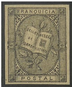
Afb. 3 Portvrijdom- zegel

Van juli tot december 1881 kreeg hij een portvrijdomzegel om zijn "Historische Verhandeling over de Spaanse Postzegels" te versturen (afb.3).