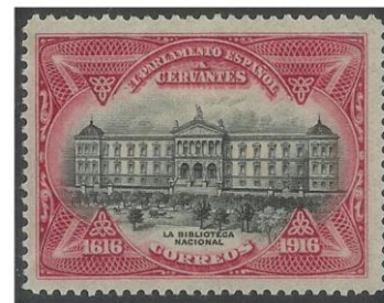
Afb. 1 en 2 Portvrijdom zegels

Portvrijdomzegels werden ook uitgegeven in Spanje ten behoeve van volksvertegenwoordigers. In 1916 ontvingen Spaanse parlementsleden portvrijdomzegels (afb. 1 en 2). Deze zegels worden ook wel afgevaardigdenzegels genoemd. Verder zijn mij dergelijke zegels bekend uit Portugal ten behoeve van het Rode Kruis en andere charitatieve instellingen. In 1945 verleende men zelfs portvrijdom aan de organisatoren van een internationale postzegeltonoonstelling.