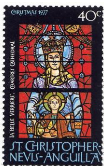
Notre Dame de la Belle Verrière, raam in de kathedraal van Chartres, 12 e eeuw