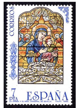
Maria met Kind, raam in de Kathedraal van Sevilla (ca. 1880)

zonder dat het daarvoor noodzakelijk is bepaalde historische tijdvakken of tijdsaanduidingen te gebruiken, zoals in het eerste plan nog werd gedaan.