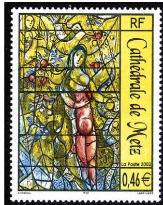
Eva en de slang, raam van Marc Chagall (1963), Kathedraal Metz

Het laatste plan maakt duidelijk, dat het heel goed mogelijk is om de geschiedenis van iets te vertellen,