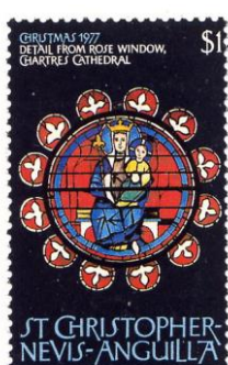
Maria Theotokos, centrale deel van het 'Rose de France' in de kathedraal van Chartres (1233).