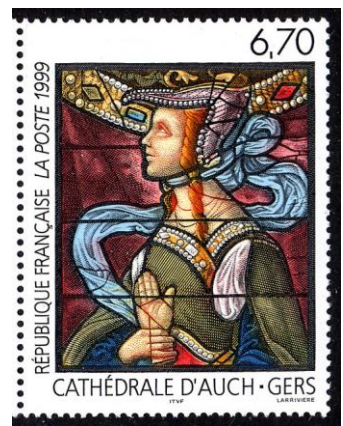
Sybille van Tibur, raam van Arnoud de Moles (16 e eeuw) in de kathedraal van Auch (Frankrijk)

Uit het eerste plan blijkt dat de structuur van haar thema al in het begin aan deze inzenderster voor ogen stond. Behalve de later ingevoerde boeiende hoofdstuk- en paragraaftitels, is ze ook op allerlei kleine punten blijven schaven, bijvoorbeeld door net een iets andere plaats in het plan. Het is duidelijk dat ook in dit geval de inspanningen hun resultaat hebben opgeleverd. ■