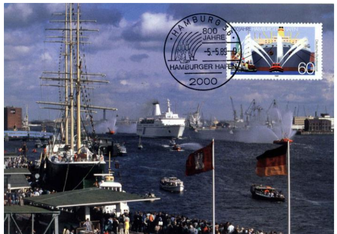
Afb. 6 Mooie overeenstemming tussen kaart, zegel en stempel

De maximumkaarten zijn niet op ware grootte afgebeeld in verband met de beschikbare ruimte en dus niet overeenkomstig de vereiste afmetingen.