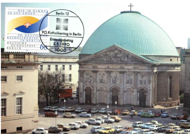
Afb. 5 Net niet volmaakt (zie tekst)

De illustraties werden welwillend ter beschikking gesteld door twee juryleden voor de maximafamilie, namelijk de heren F.S.J.G. Hermse en D. Koelewijn, waarvoor mijn hartelijke dank.