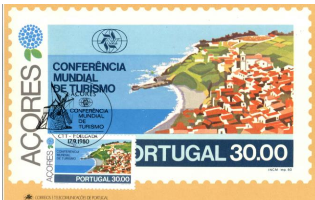
Afb. 1 Fout, de kaart is een reproductie van de postzegel

Maximafilie behoort tot de door de FIP (Fédération Internationale de Philatélie) volledig erkende klassen voor internationale tentoonstellingen. Dat wil zeggen dat collecties die alleen uit maximumkaarten bestaan, in deze klasse kunnen worden ingezonden. Zij worden beoordeeld volgens 'Bijzondere Regels' en 'Richtlijnen' voor de maximafilie, zoals we die ook kennen voor de thematische filatelie.