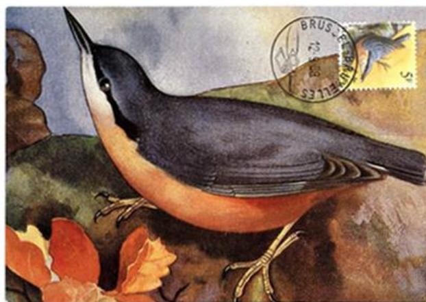
Afb. 4 De afbeelding op de kaart komt niet overeen met de zegel en het stempel.