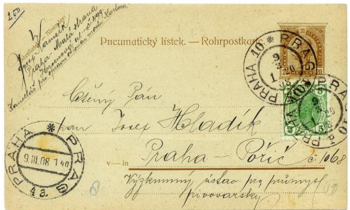
Afb. 2 Praagse buizenpost 1908

De eerste stedelijke buizenpost werd in 1865 in Berlijn geëxploiteerd tussen het hoofdkantoor van de telegrafie en het beursgebouw. Naast Londen en Berlijn hadden o.a. ook München, Bremen, Frankfurt aan de Main,