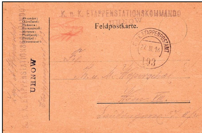
Afb. 3 Post verzonden via het K.u.K. Etappenpostamt in maart 1918

De etappepost is een bijzondere vorm van veldpost. Direct na oorlogshandelingen functioneert de burgerpost vlak achter het front nog niet normaal. In sommige gevallen geeft de veldpostdienst aan de daar wonende burgers gelegenheid van hun organisatie gebruik te maken (afb.3).