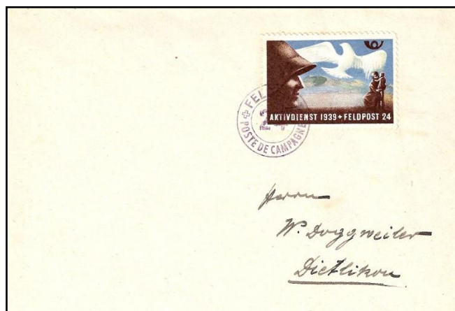
Afb. 2 Veldpostbrief met een Zwitserse soldatenzegel uit de Tweede Wereldoorlog

In verreweg de meeste gevallen zijn veldpostzendingen portvrij. Soms wordt echter alleen aan militairen van lagere rang een (gereduceerd) porto berekend. In enkele gevallen worden er ook speciale veldpostzegels uitgegeven. Omdat deze zegels worden uitgegeven door de militaire autoriteiten en niet door de posteries, zijn het strikt genomen cinderella's of vignettes. Bekend zijn de Zwitserse soldatenzegels (afb.2). Ook de zegels van de Duitse Inselpost (behandeld in een eerdere aflevering van Bijzondere Post) behoren tot deze categorie. In sommige catalogi worden deze zegels opgenomen en ze worden vaak verzameld.