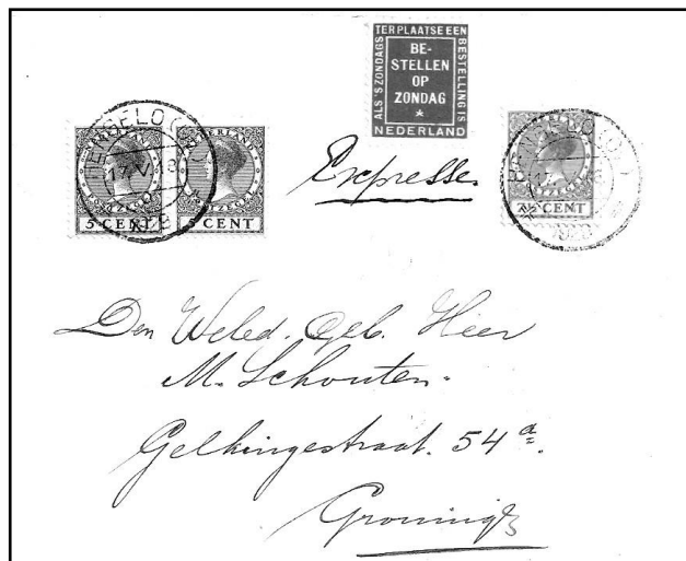
Afb.4 Bestellen onder voorwaarde

In 1919 werd een nieuw etiket in gebruik genomen. Het was donkerblauw en droeg de tekst "Bestellen op zondag". Ze dachten bij de PTT, niets voor niets, en de mensen moesten er toch weer voor betalen. De prijs: één cent per tien stuks. Het aantal postbestellingen op zondag nam drastisch af, vooral in kleinere plaatsen.