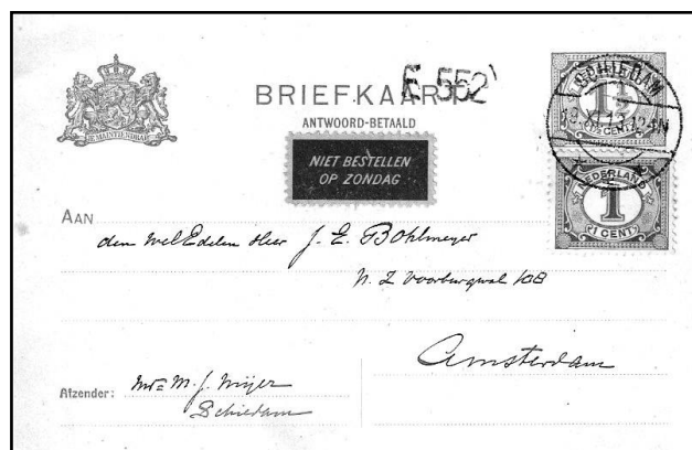
Afb.2 Het eerste etiket: niet bestellen op zondag

Vanaf 1912 waren etiketjes verkrijgbaar die men op zijn brieven kon plakken. Het waren rode op geel papier gedrukte plaatjes met de tekst "Niet bestellen op zondag". Voor een velletje van vijftig stuks moest je één cent betalen. Na veel kritiek waren de etiketten vanaf 1 augustus 1916 gratis te krijgen. In de periode januari 1912 tot augustus 1916 werden 98.031 van dergelijke velletjes verkocht. Dit leverde dus f 980,31 op. Buitenlandse post was uiteraard nooit voorzien van zo'n plakplaatje en werd dus altijd op zondag besteld.