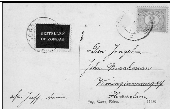
Afb.3 Bestellen op zondag

afscheuren van het strookje bepalen of je de factuur op zondag voor je wilde laten werken. Liet je het strookje aan de postzegel zitten, dan werd je post niet op zondag bezorgd. Er verschenen ook briefkaarten. Onder de waardeindruk stond de genoemde tekst. Als je de post toch op zondag wilde laten bestellen, moest je die tekst doorhalen.