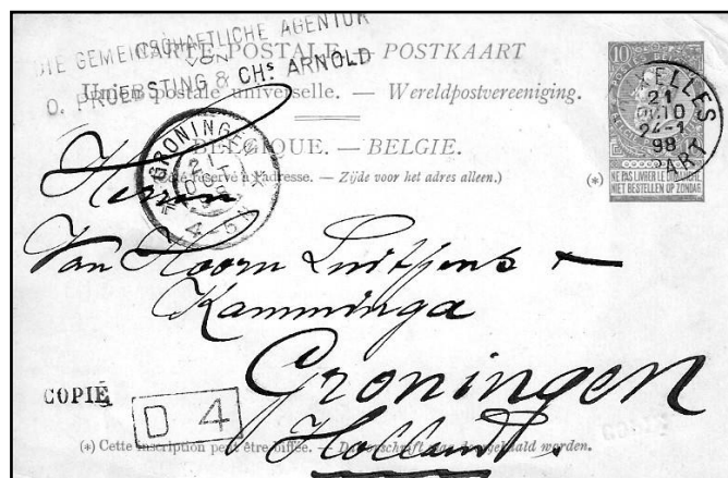
Afb.5 Een Belgisch postwaardestuk met keuzemogelijkheid

In België waren ze al veel vroeger met dit probleem bezig dan bij ons. In 1893 werden postzegels met aanhangsels uitgegeven. Daar stond op "Ne pas livrer le dimanche/Niet bestellen op zondag". Je kon door het