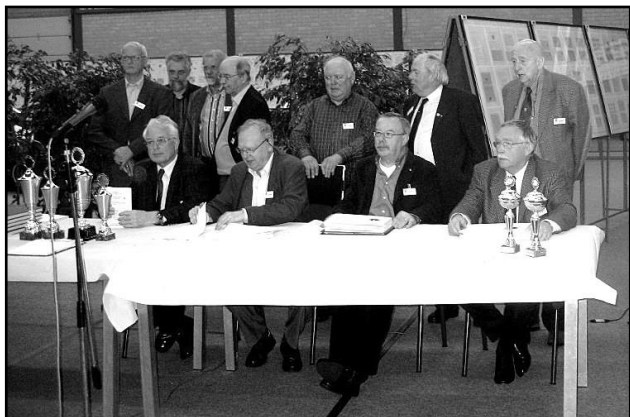
De jury gereed voor de prijsuitreiking

niet. Er zijn namelijk talloze criteria waar plan en ontwikkeling aan moeten voldoen, die niets te maken hebben met de door de inzender gekozen richting. Om uit de veelheid van mogelijkheden er nog maar eens twee te noemen: een logische volgorde van de hoofdstukken in het plan en een diepgaande uitwerking in de ontwikkeling in plaats van het vermelden van wat algemeenheden, die iedere leek op het gebied van uw thema ook nog wel onder de stukken kwijt zou kunnen. Dat zijn namelijk noodzakelijkheden en geen aanbevelingen. Zij zijn van een geheel andere orde dan suggesties in de geest van: "Zou het niet aardiger zijn om dit zus of zo te doen?"