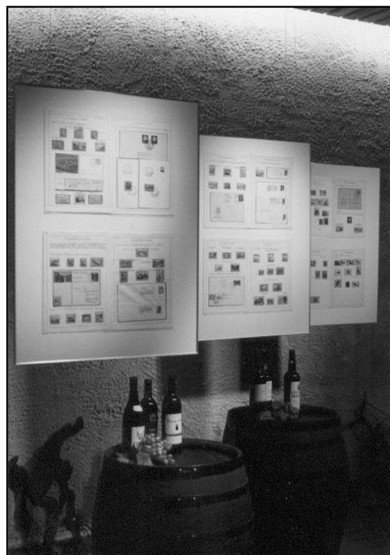
Tot besluit: Goede wijn met een filatelistische krans!

Laat u in de thematische filatelie in de eerste plaats leiden door uw eigen gezonde verstand!