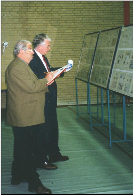
De jury in actie

We hebben al gezien hoe juryleden te werk gaan. Toch blijven het gewone mensen die fouten maken. De beschikbare tijd is bovendien bijna altijd te kort. Het plan wordt meestal wel in zijn geheel beoordeeld, maar voor de thematische kennis en de ontwikkeling moet uiteraard altijd met steekproeven worden volstaan, die gunstig of juist minder gunstig kunnen uitvallen. Wel wordt altijd geprobeerd alle stukken in zich op te nemen, om een zo goed mogelijk oordeel over filatelistische kennis en zeldzaamheid te kunnen geven. Toch wordt nog wel eens een stuk over het hoofd gezien of wordt de uitzonderlijke betekenis van een bepaald stuk niet onderkend. Zo leert ook het jurylid weer van iedere tentoonstelling. Een constatering die overigens meer troost zal schenken aan de juryleden dan aan de inzenders.