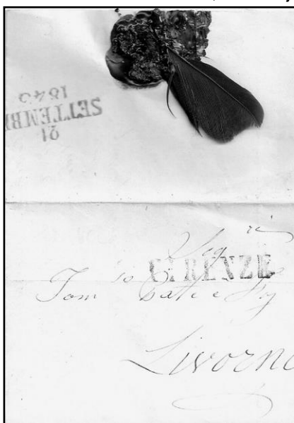
Afbeelding 1. Italiaanse verenbrief

overdag mocht worden vervoerd. Een zwarte en een witte veer zou aanduiden dat de brief het hele etmaal moest worden vervoerd, dus dag en nacht. Ook gaat het verhaal dat een brief met meer veren sneller moest