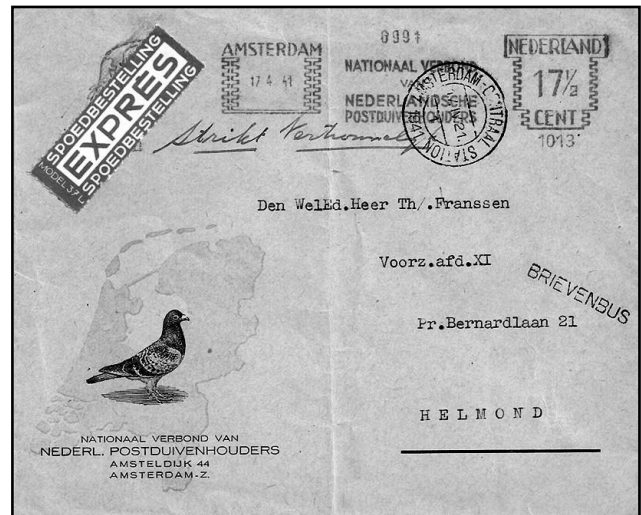
Afbeelding 3. Een expresbrief uit 1941

Uiteraard moest je voor die exprespost wel extra betalen.