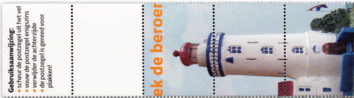
61-6 a en b