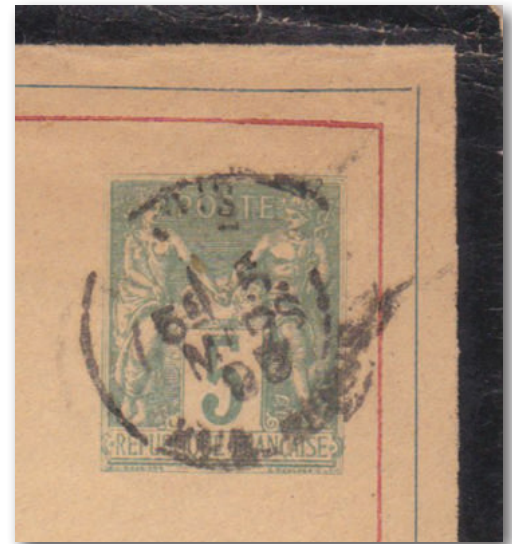
72-5 Ingedrukte zegel