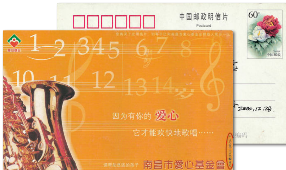
6a en 6b

vertaald en geïllustreerd door Arnold van Berkel