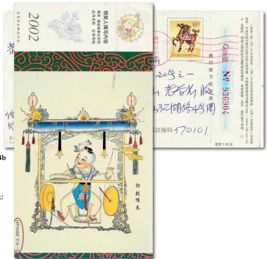
4a en 4b