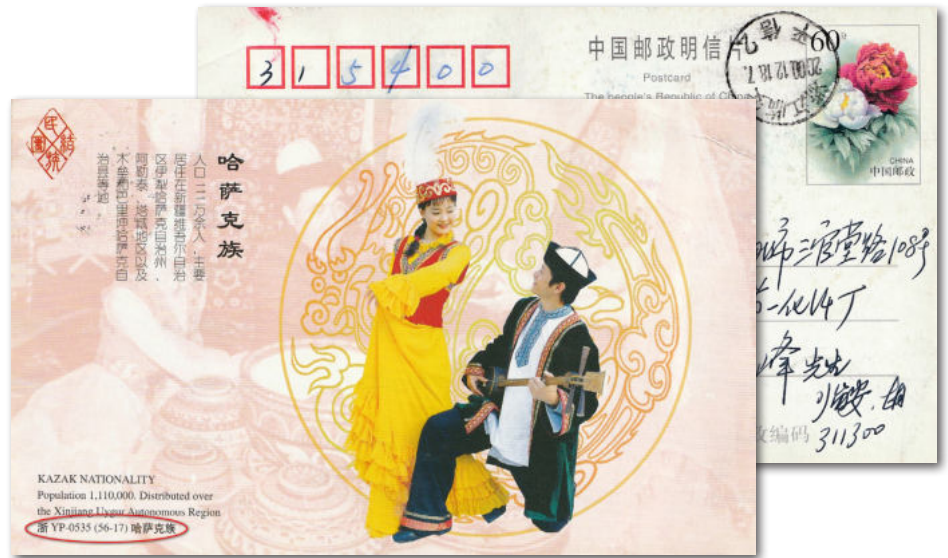
3a en 3b

Bij de loterijkaarten kan men nationale en regionale kaarten onderscheiden. De nationale kaarten waren op elk postkantoor verkrijgbaar en tonen sinds 1996 een registratienummer op de beeldzijde met het volgende schema: HP <jaar> (nummer) of HP <jaar> <serie> (nummer). Voorbeeld 4a en b: HP 2002 C (4-3) = nieuwjaarsloterij 2002; serie C (kaart 3 van 4) (muzikant met bekkens en gong).