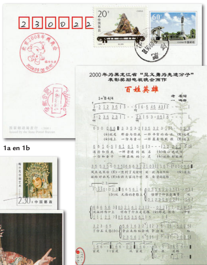
1a en 1b

De kaart van afbeelding 1a en b (Chinese muzieknootatie m.b.v. cijfers: jianpu) lijkt in orde, maar is een uitzondering: type 'JYC' staat niet in de tabel.