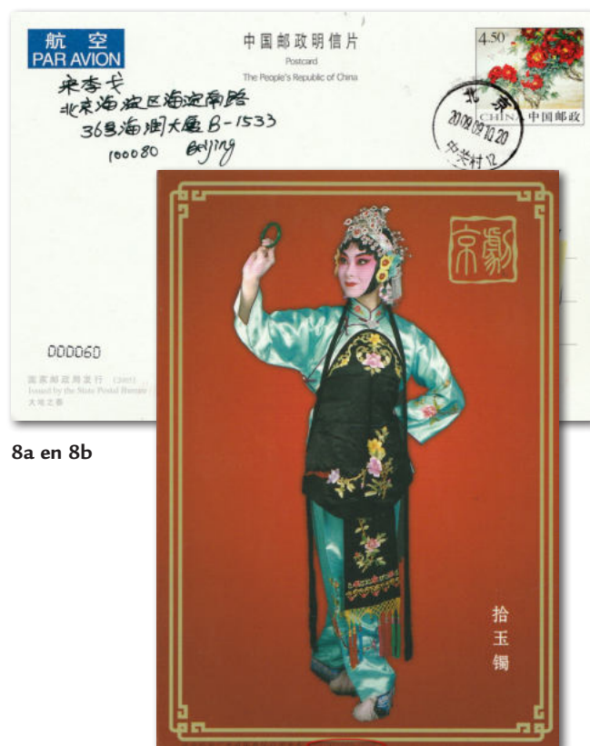
8a en 8b