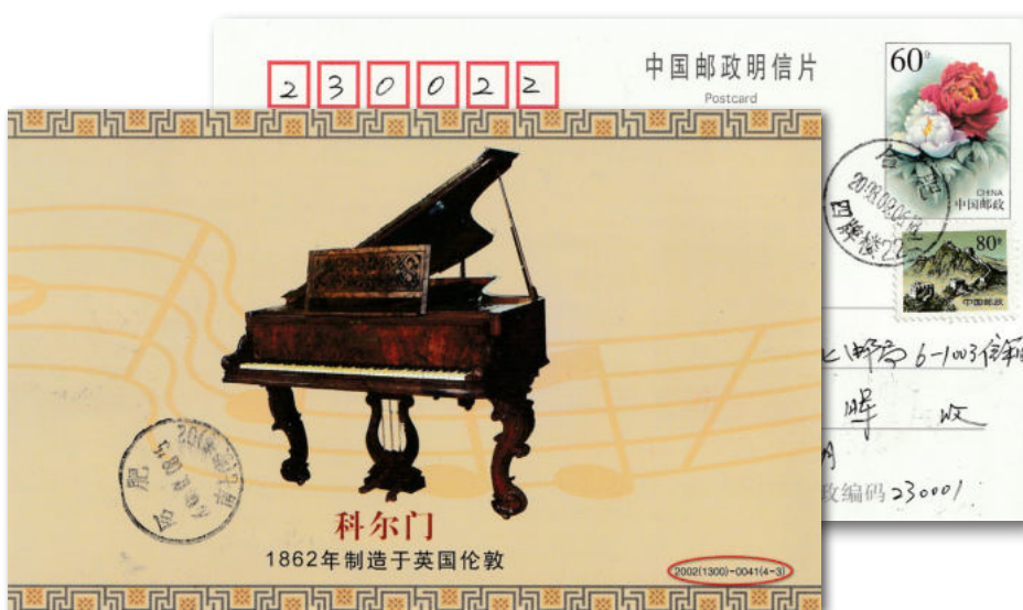
7a en 7b