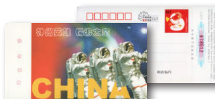
83-6a en b

De kaart is niet specifiek filatelistisch uitgegeven (maakwerk). Ja, het stuk mag in een tentoonstellingsverzameling. Het is een postwaardestuk (met lot). Maar misschien ben ik te snel met voluit ja te zeggen: het stuk lijkt regionaal en was mogelijk niet algemeen verkrijgbaar, dat is een reden om het niet op te nemen.